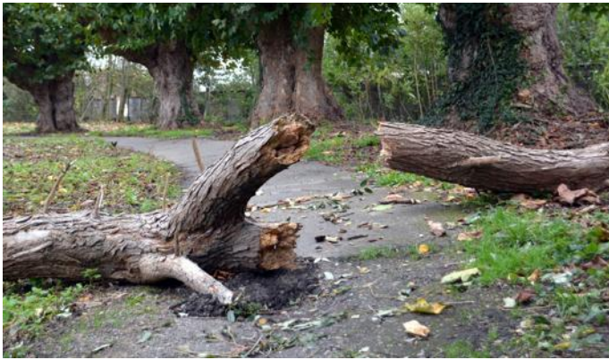
Un arbre s'est couché entre les bans de Benfeld et Huttenheim (chemin piétonnier le long du Muhlbach).