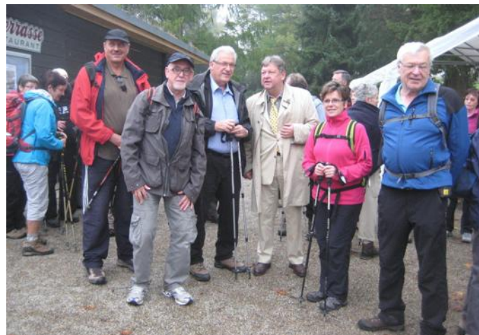
Les maires des deux villes jumelées, et les présidents des clubs de randonnée. DOC. REMIS

L'après-midi, la sortie s'est déroulée le long du petit zoo, puis vers la « Wisserswand » et le « Bruckwald » avec de beaux points de vue sur la Ville de Waldkirch et sa belle ruine du Kastelburg. Après